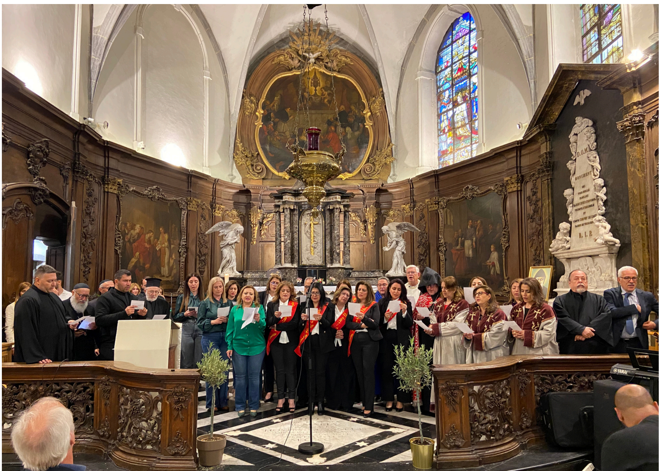
Chant final (Ave Maria) interprété en arabe et en français par l'ensemble des chorales orientales accompagnées des prêtres, de Mme Alsberge et de Tommy Scholtès.